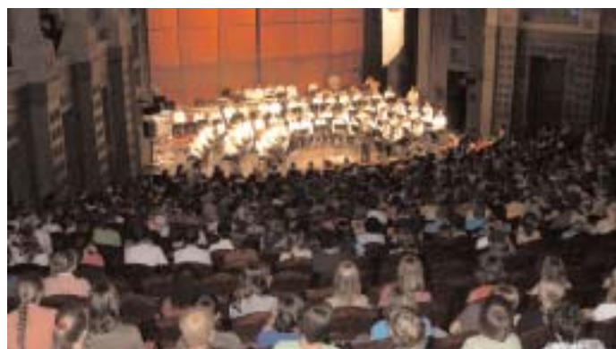
So voll, so jung und so wuselig wirds auch im Prinzregententheater nur sehr selten sein...